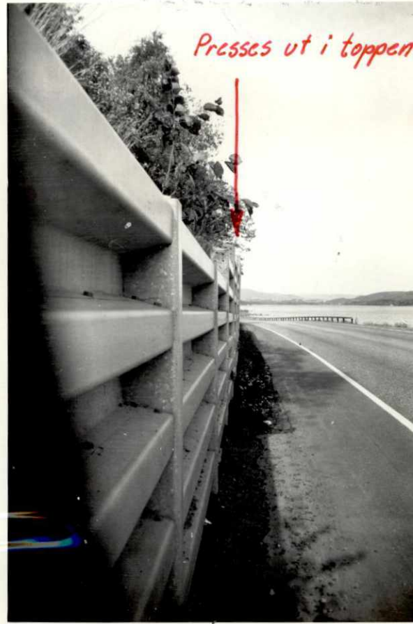
Presses ut i toppen