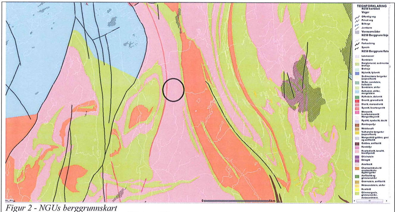
Figur 2 - NGUs berggrunnskart

Dette vurderes til å bekrefte NGUs løsmassekart som tilsier bart fjell/tynt dekke mot øst og vest.