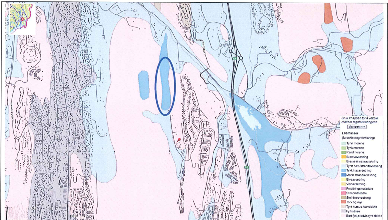
Figur 1 - NGUs løsmassekart