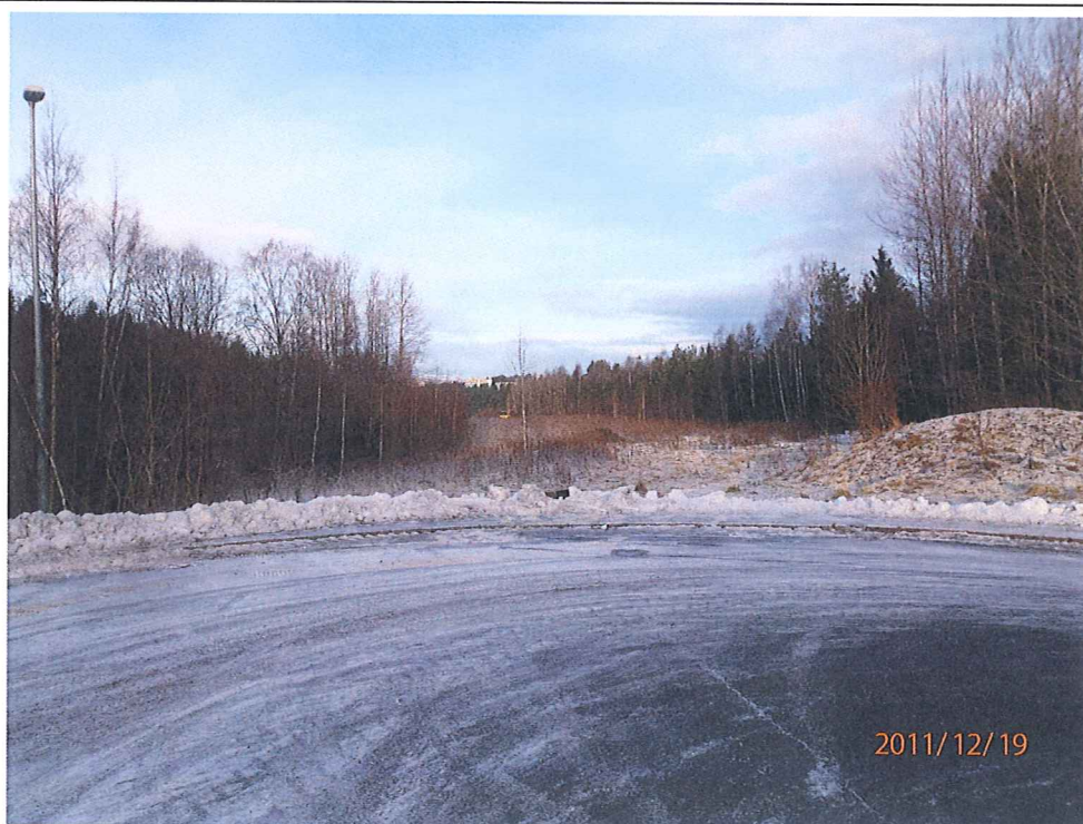
Bilde av tomta, tatt mot nord