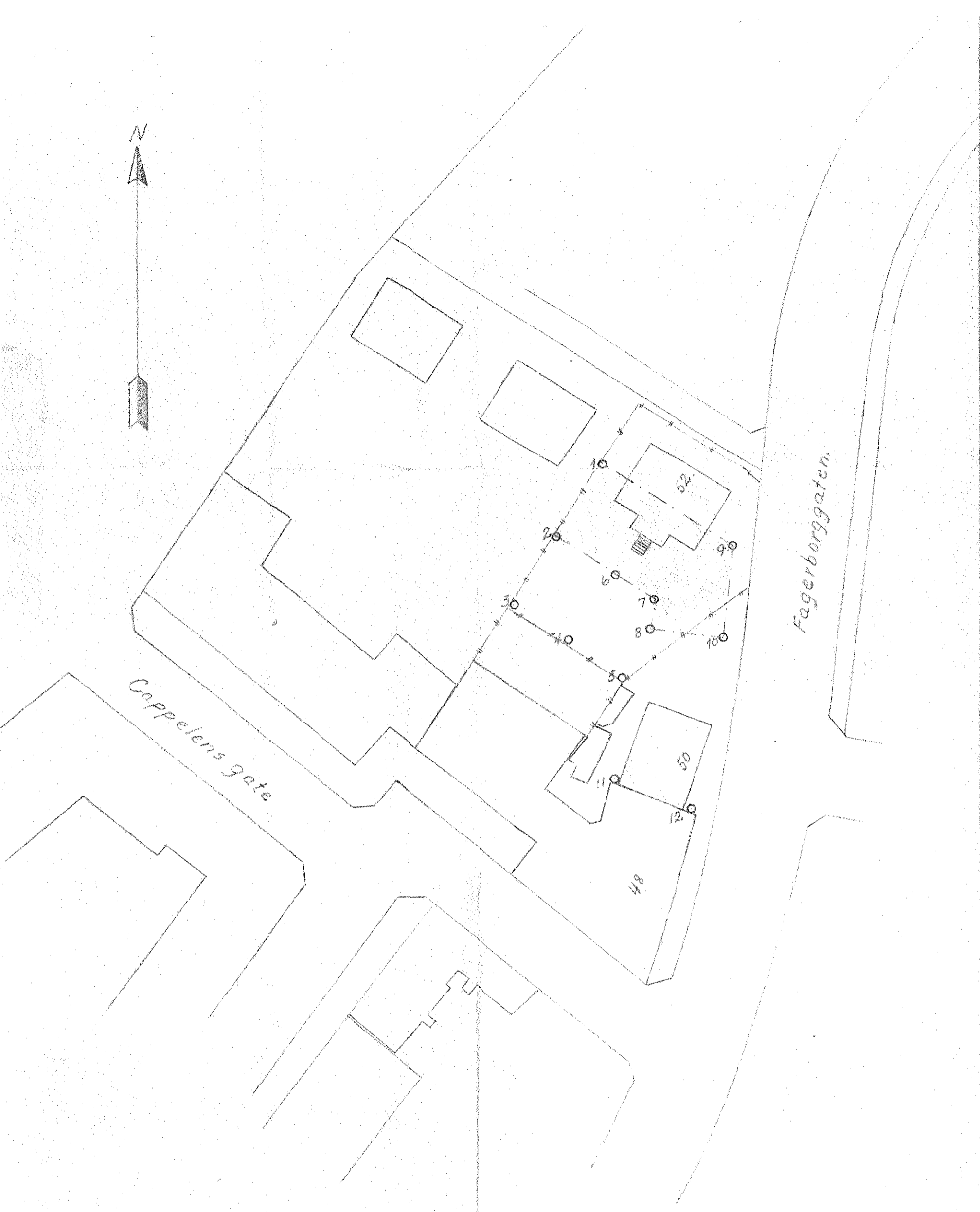
Situasjonsplan. Mål 1:500.

Trasé etter ark. Jan Lie-Nielsens tegn. nr. 288, med korleksjon av Fagerborggt. 48