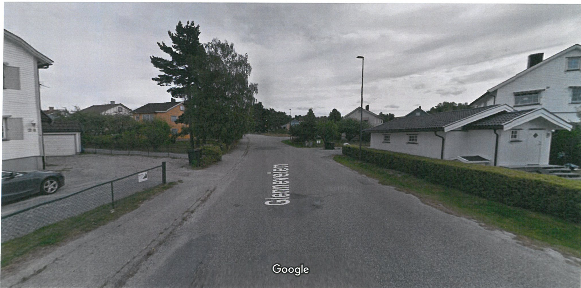
Bildet er tatt: jul. 2017 © 2019 Google