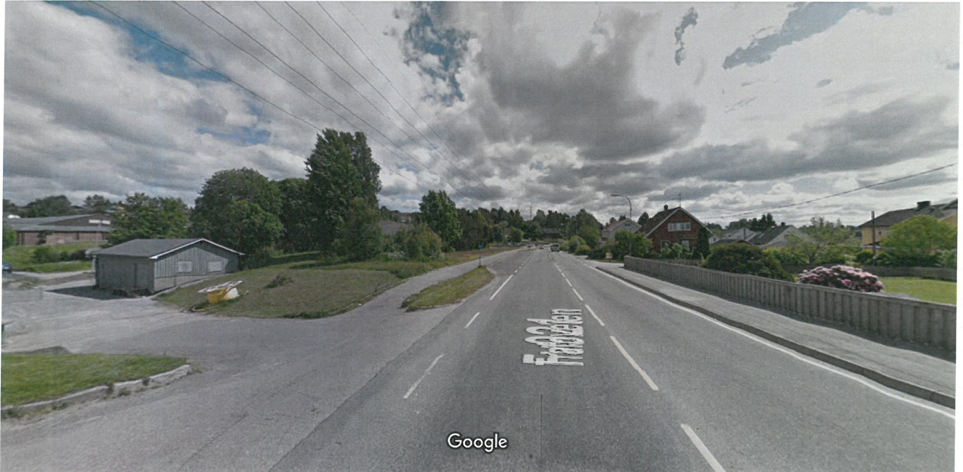
Bildet er tatt: jun. 2012