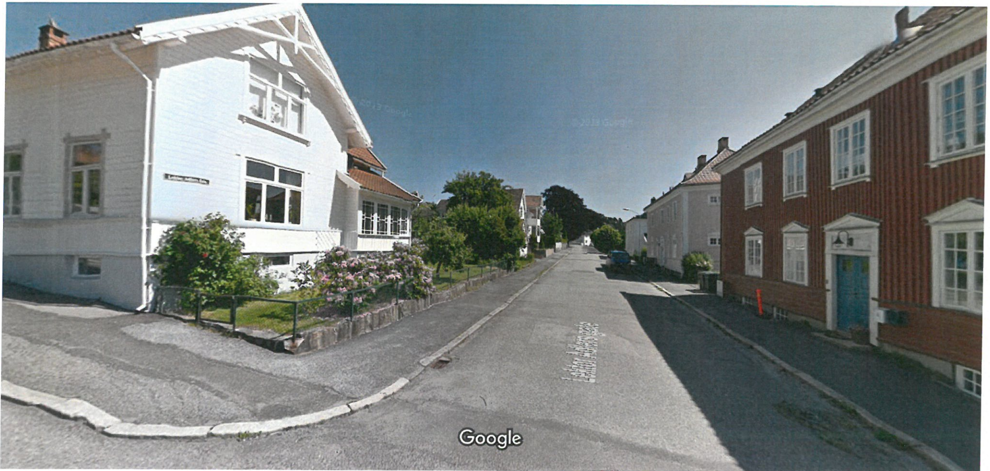
Bildet er tatt: jun. 2012