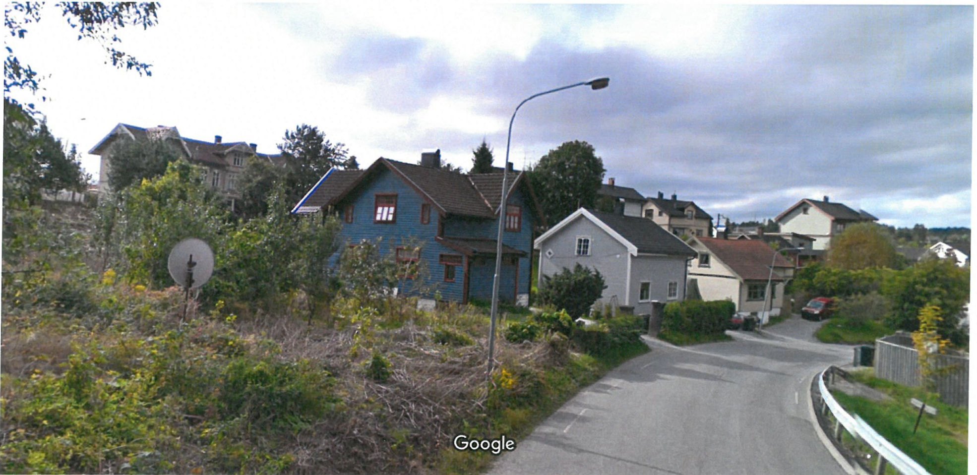
Bildet er tatt: sep. 2010